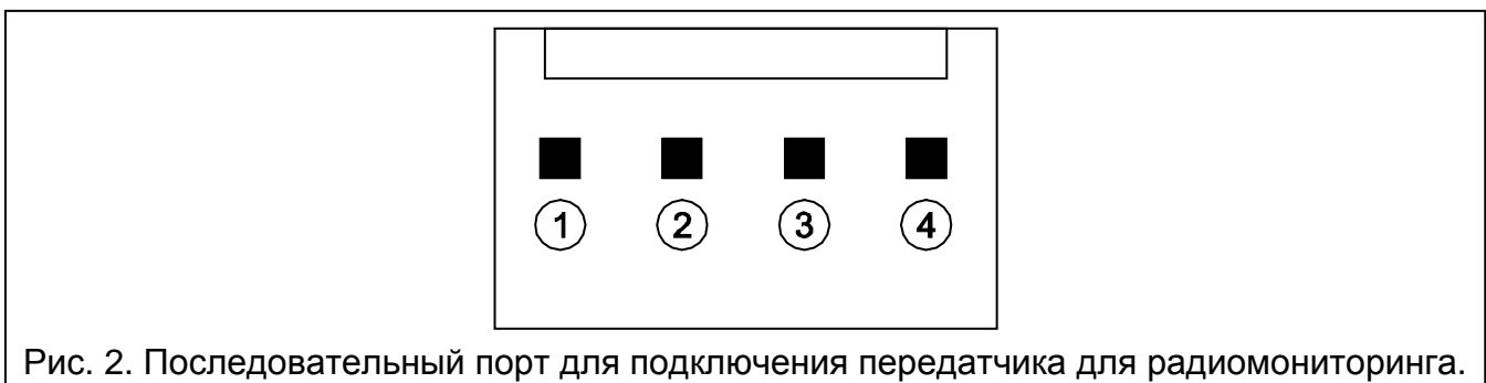
Рис. 2. Последовательный порт для подключения передатчика для радиомониторинга.